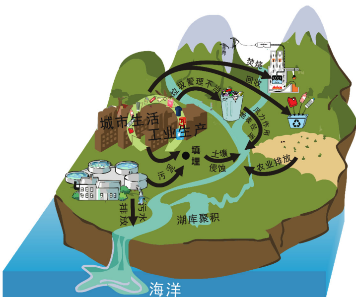
图2 环境中微塑料来源与迁移途径示意图

微塑料还是环境中污染物的重要载体。微塑料对多环芳烃（PAHs）、多氯联苯（PCBs）、有机氯农药（OCPs）等持久性有机污染物表现出较强的吸附能力，这与塑料的疏水性有关 [26] 。重金属也能吸附到微塑料表面，而且风化导致的微塑料表面变化有利于重金属的吸附 [9] 。此外，塑料本身也可能含有聚合物单体、塑化剂、阻燃剂、抗氧化剂等有毒化学物质，并会在进入水体后将这些污染物逐渐释放出来 [27] 。微塑料表面还可供水体